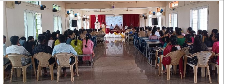
Cadets and Geography Department students.